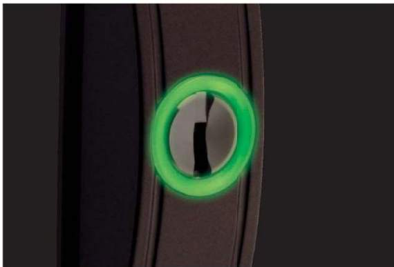
夜間蓄光リング(イメージ図)